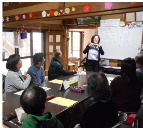
▲「らいおん千葉」で楽しく学ぶ手話学習会の様子

言葉の発声を覚えたあとに聴力を失った為、先天性の聴覚障害と違い、聞こえなくても発語が出来るという特徴があります。発語ができるため聞こえていると思われてしまい「聞こえないということを周囲に伝えづらくて苦しい」という方が多くおられます。そんな方のために「1人で悩まないで一緒に考えよう」と「らいおん千葉」では、第2・3土曜日の午後1時～午後3時まで、中途失聴者・難聴者を対象に手話学習会を開いています。手話学習を通じて、筆談の他に手話を習得することで、より早くより多くの情報を得ることができる。前向きになれる。笑顔になれる。「らいおん千葉」は、そんなオアシスです。